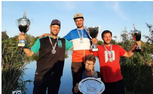
Tableau des médailles à l'international

Notre nation se classe au 3ème rang mondial dans nos disciplines mais au 2ème rang si on priorise les médailles d'or.