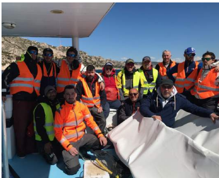
Présélection de l'équipe