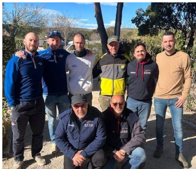
Équipe de France 2023